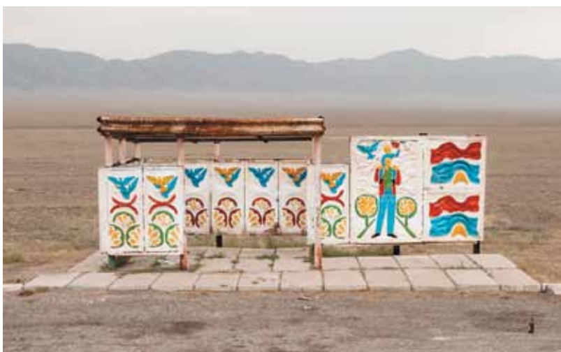
Arrêt de bus à Charyn, Kazakhstan - Christopher Herwig - Soviet Bus Stops - Editions Fuel