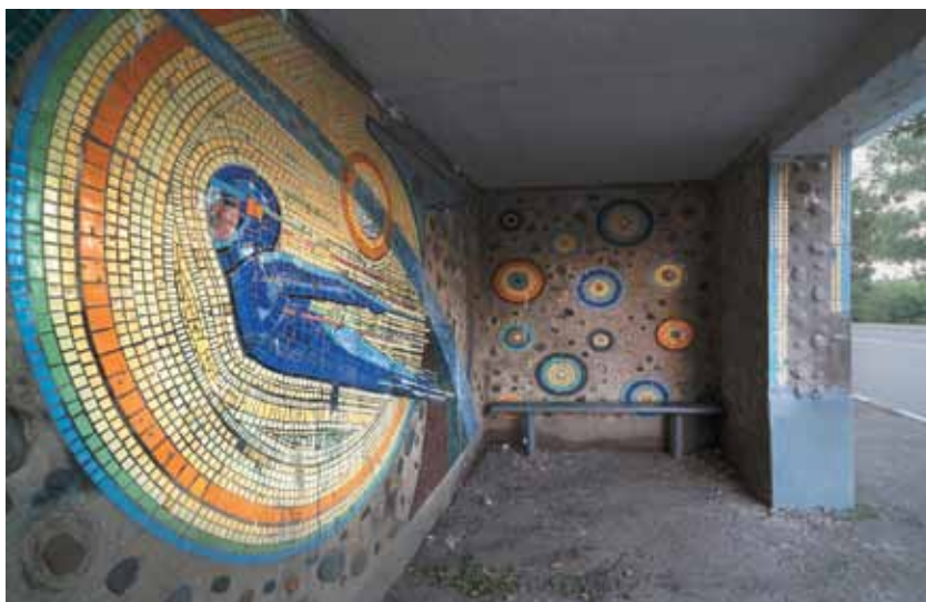
Arrêt de bus à Ivanovo, Russie

angles différents de ceux de la main du chirurgien : des évolutions qui entraînent moins de suites opératoires pour le patient. Les promesses sont nombreuses aussi dans le domaine