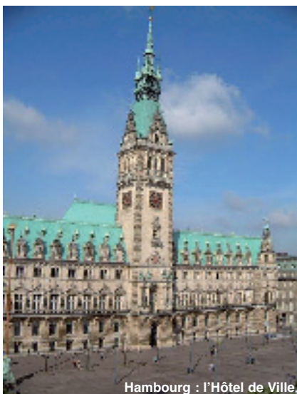
Hambourg : l'Hôtel de Ville.

Notre section FDM-ADFE de Hambourg a organisé un tournoi de pétanque à la rentrée. Le bureau n'avait pas lésiné sur les grignotages et la buvette qui ont attiré de nombreux participants, sous le soleil. Des rugbymen venus en voisins ont même troqué le ballon ovale pour le tournoi. Des lots ont récompensé les vainqueurs des épreuves. Le convivial, ça marche !