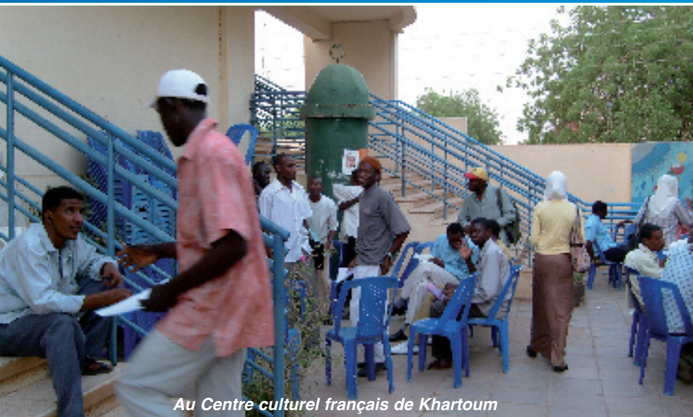
Au Centre culturel français de Khartoum

Association Démocratique des Français à l'Étranger