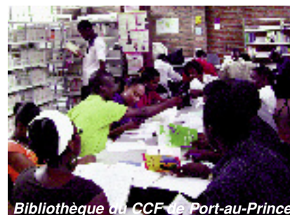
Bibliothèque du CCF de Port-au-Prince