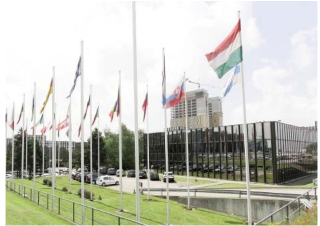
Les bâtiments du Parlement européen à Strasbourg, Luxembourg et Bruxelles