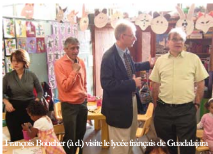
François Boucher (à d.) visite le lycée français de Guadalajara

Grand comme presque quatre fois la France, premier pays indien d'Amérique, berceau des civilisations aztèque et maya, le Mexique est aussi le premier pays hispanique du monde avec une population de plus de 100 millions d'habitants. Membre de l'OCDE, cette république fédérale est un pays émergent avec de grandes ressources pétrolières mais aussi agricoles, naturelles et touristiques. Cependant ce pays est confronté à de grands problèmes : fortes inégalités, pauvreté, en particulier des États du Sud, migration, corruption et une guerre du narco trafic ayant fait en 2008 plus de 5000 morts !